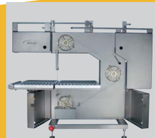
Linksauslage / Left sided version

Varianten für unterschiedliche Einsatzbedingungen: Wahlweise ist die K 800 als Rechts- oder Linksauslage, mit Schwenktüren oder Schiebetüren sowie fester Tischplatte oder Rollentisch lieferbar. Optional versions for different conditions: The model K 800 is optionally available in right sided or left sided version, swivel or sliding doors, fixed table or roller table.