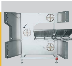
Rechtsauslage / Right sided version

Gründliche Reinigungsmöglichkeit durch einfach herausnehmbare Rollen (Rollentisch optional) Removable rollers plus general easy access permit perfect sanitation (roller-table optional)