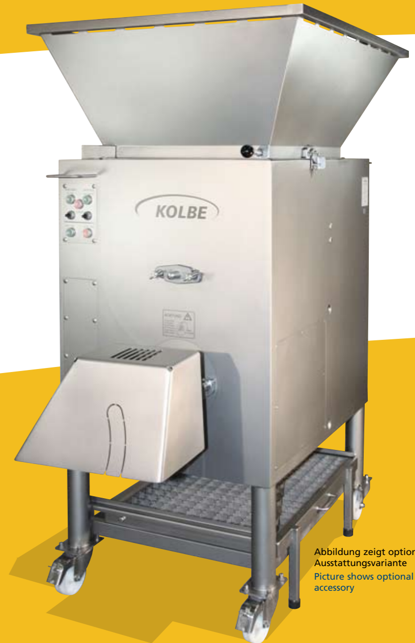
Abbildung zeigt optionale Ausstattungsvariante Picture shows optional accessory

The high-performance-mincer with extended dimension in worm and cutting space ensures high output by best cutting results.